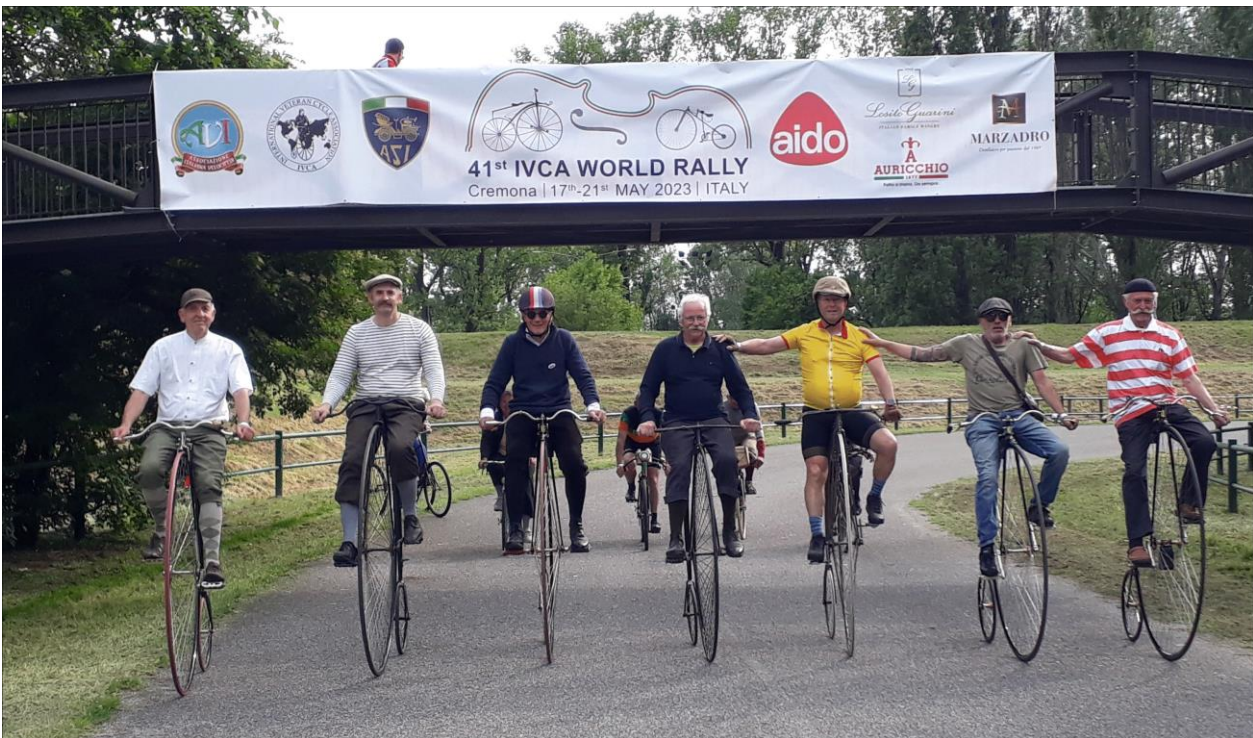
Sortie de 7 des 17 bicyclistes le 18 mai 2023 à Cremona, Italie (IVCA = International Veteran Cycle Association)