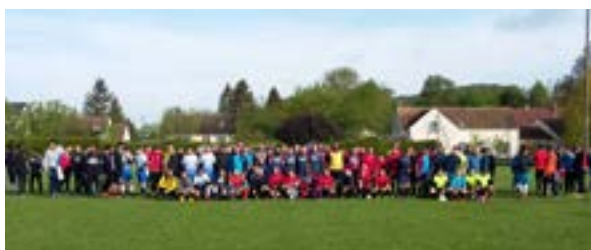
Tournoi de Chaussy 1 er mai 2018 160 joueurs victoire de l'équipe de Gasny

19/20 mai 2018 tournoi international de Cologne, nos seniors terminent 10 ème sur 16 équipes (Allemands, Suisses, Hollandais, Belges et Français).